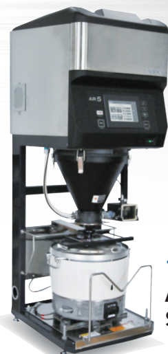
1釜手動点火 AR455 SB13 (1~3升)