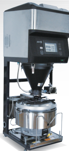
1釜手動点火 AR455 SB15 (2~5升)