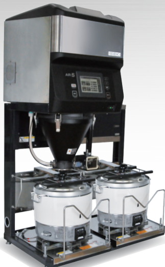
2釜手動点火 AR555 SB23 (1~3升)