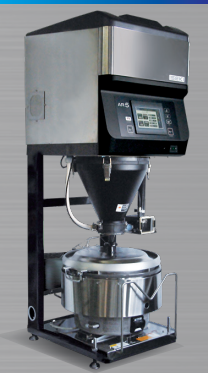
▲1釜手動点火 AR455 SBK15(2~5升)